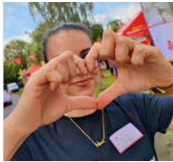
22.05.2025 - Stadtfeld Ost, Stolzestraße 2